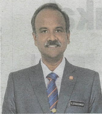
Menteri Sumber Manusia, V. Sivakumar

Pandangan baharu terhadap alam pekerjaan telah diperolehi menerusi maklumat pasaran buruh. Pertubuhan Keselamatan Sosial (Perkeso) sebagai agensi di bawah Kementerian Sumber Manusia, menyediakan perlindungan sosial di bawah Akta 4, Akta 789, Akta 800, dan Akta 838. Dengan pengumpulan data bulanan pencarum di bawah Akta 4, Perkeso mempunyai maklumat yang relevan berkenaan pekerja dan majikan di sektor swasta untuk mengukur trend dalam pasaran buruh.